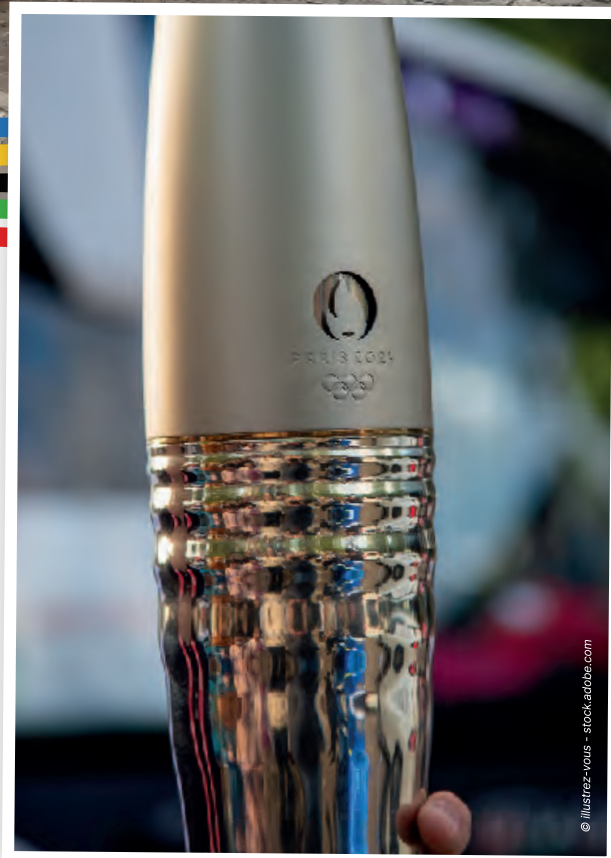
La flamme olympique de Paris 2024

L'été 2024 a été marqué par la tenue des Jeux olympiques en France et à cette occasion, notre commune a eu l'honneur d'assister au passage de la flamme.