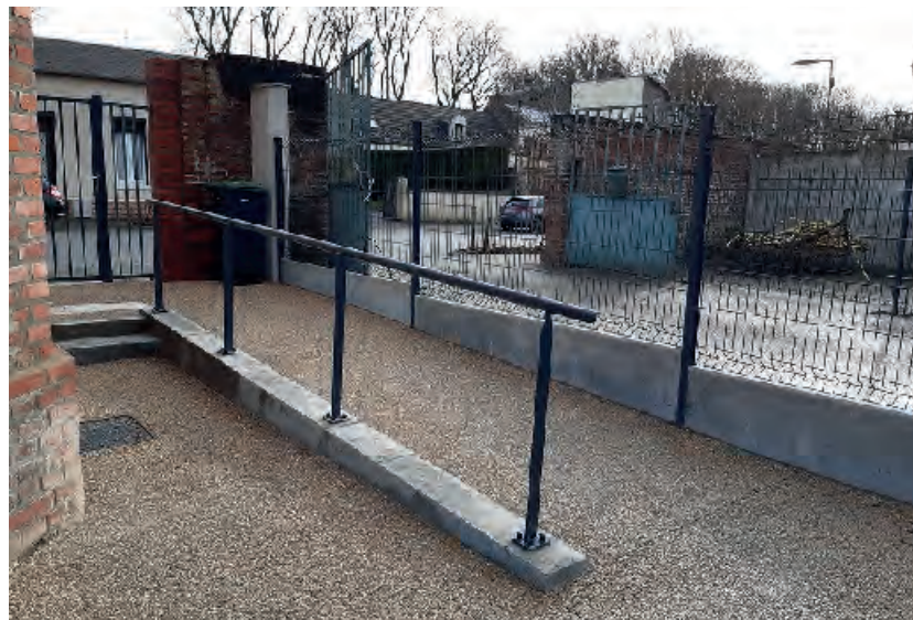
Un accès piéton PMR a été mis en place pour l'accueil de tous

Après 5 mois de travaux de réhabilitation énergétique et d'aménagement intérieur, les clefs de la nouvelle salle seront remises aux futurs occupants, fin février. Les membres de l'UNRPA, de la MPT et du Diggers club bénéficieront de ce nouveau lieu.