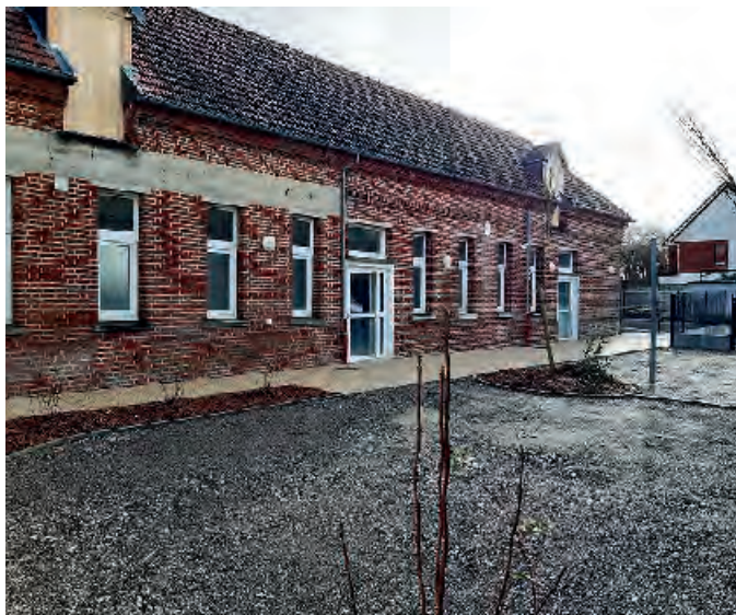
La nouvelle salle, rénovée et adaptée à de nouveaux usages!