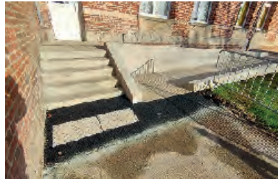
La rampe PMR à l'école Saint-Exupéry

⇒ 207 enfants , répartis en 9 classes , sont rentrés en primaire de l'école Victoria. Mme Tabary, nouvelle professeure, a rejoint l'équipe de M. Holleville.