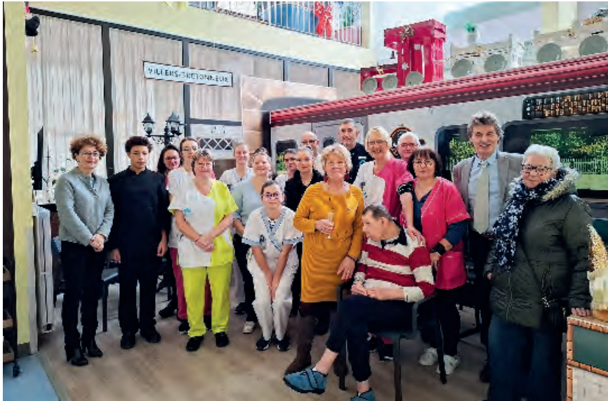
L'équipe soignante, les résidents et l'équipe municipale

Ne rompant pas avec la tradition, monsieur le Maire a présenté ses meilleurs vœux aux résidents de la Maison de retraite Firmin Dieu et a remis à chacun un colis, autour d'un apéritif.